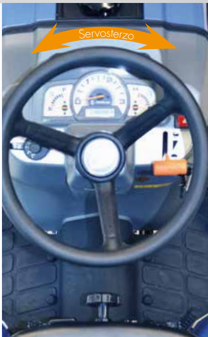
Servosterzo idraulico (vers. "I") ideale per l'utilizzo di attrezzature frontali