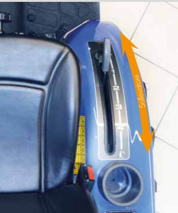
Sollevatore posteriore con comando a posizione controllata