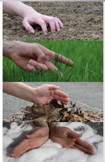
Molteplici attrezzature a scelta per l'utilizzo in tutte le stagioni nel giardino ed in agricoltura